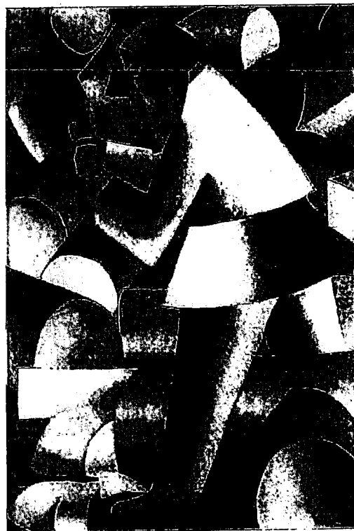
1 Kazimir Malevitsj: Bader, 1911 werk op papier Collectie Stedelijk Museum 2 Suprematisme: Zelfportret in twee dimensies, 1915 olieverf op doek Collectie Stedelijk Museum 3 Galant gezelschap in een park, 1908, werk op papier Collectie Stedelijk Museum/Chardzjev 4 Mystiek suprematisme, 1920/22, olieverf op doek Collectie Stedelijk Museum 5 De houthakker, 1912, olieverf op doek Collectie Stedelijk Museum